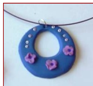
Martisoare realizate in atelier