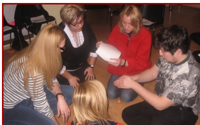
Lucru pe grupuri in cadrul cursului

judetele din care provin si unde activeaza. Astfel, misiunea cozelor noastre si a echipei Inima de Copil este ca, in perioada urmatoare, sa initieze si sa dezvolte 10 astfel de cluburi la nivelul liceelor din Galati.