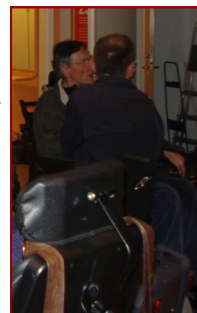
Amenajarea spatiului, regula de baza in Suedia

copiilor si adultilor cu dizabilitati si de a compara gradul de implicare si finantare din partea statului in dezvoltarea serviciilor sociale din Romania si din Suedia. Statul suedez a implementat si finanteaza un sistem adaptat nevoilor individuale ale persoanelor cu dizabilitati. In afara unui buget adecvat pentru asis-